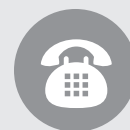
附件8 部分常用电话